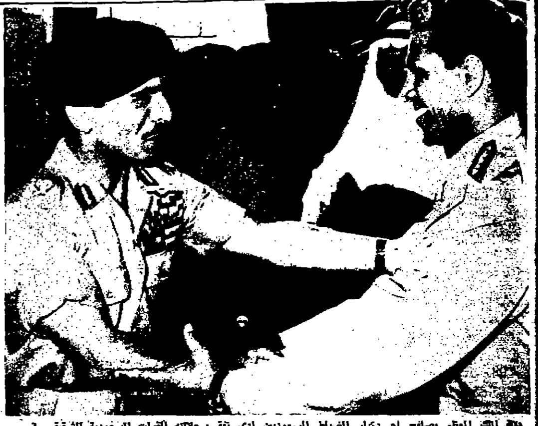
جدة الملك المعظم يصطحب احد كبار الضباط السوريين لدى تفقد جلالته القوات السورية الشقيقة الرابطة في الاردن

بدأ إسكان اليهود داخل سور القدس القدس المحتلة - (خاص بالستور) - انتقل تسعة عشر من السكان اليهود المتدينين امس للقامة في الحي اليهودي داخل سور القدس وهم اول جالية يهودية منتقلة تقطن الحي اليهودي البقية على صفحة ٦ عمود ٥